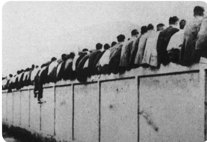
Culés en el campo de la calle de la Indústria

Se sitúa el origen de la denominación culés en una anécdota referida al campo de la Indústria. Este campo no tenía graderías y los aficionados tenían que sentarse en la parte alta del muro que rodeaba el campo, de forma que la gente que andaba por la calle en un día de partido veía una fila de culos alineados. A pesar de haber cambiado de estadio dos veces hasta el actual Camp Nou, el sobrenombre ha perdurado.